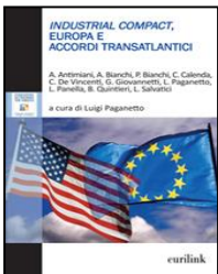
“Industrial Compact. Europa e accordi transatlantici” , a cura di Luigi Paganetto, Eurilink, 2015