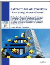
“Rapporto del Gruppo dei 20 “Revitalizing Anaemic Europe” ”, a cura di Luigi Paganetto, Eurilink, 2014