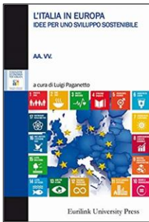
“L'Italia in Europa. Idee per uno sviluppo sostenibile”, a cura di Luigi Paganetto, Eurilink University Press, 2018