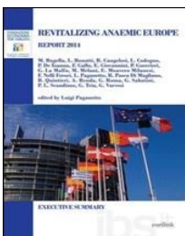
“Revitalizing Anaemic Europe. Report 2014. Executive Summary” , a cura di Luigi Paganetto, Eurilink, 2014