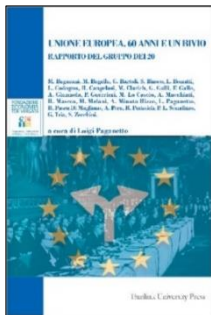
“Unione europea. 60 anni e un bivio”, a cura di Luigi Paganetto, Eurilink University Press, 2017