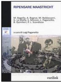
“Ripensare Maastricht?” , a cura di Luigi Paganetto, Eurilink, 2015