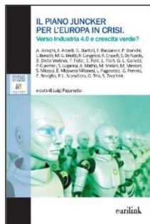
“Il Piano Juncker per l'Europa in crisi”, a cura di Luigi Paganetto, Eurilink, 2016